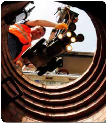
Überprüfungsarbeiten mit Hilfe eines Roboters

Ingenieure wie wir, kümmern sich um Wasser von hier.